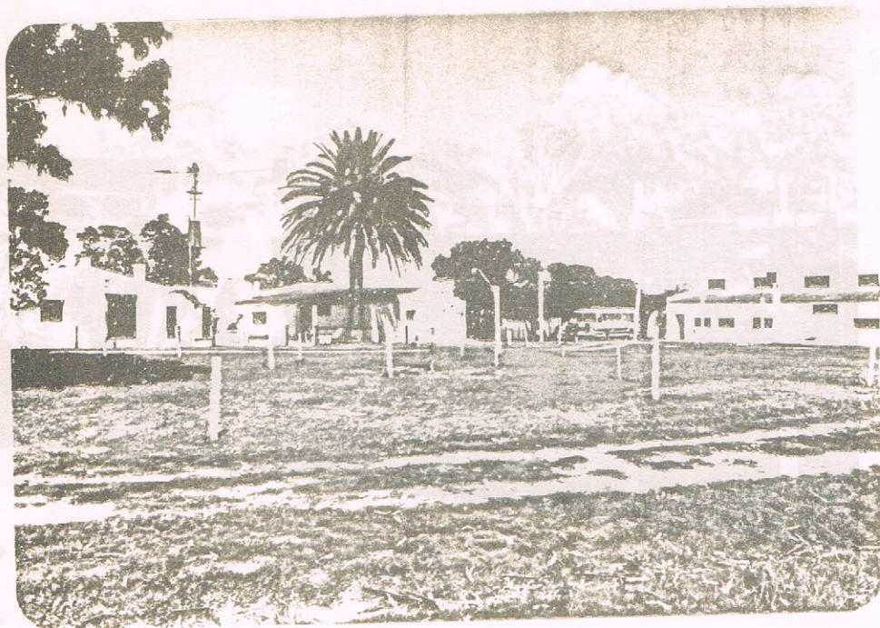
Vista de las edifica- ciones del Campo Expe- rimental N° 1.