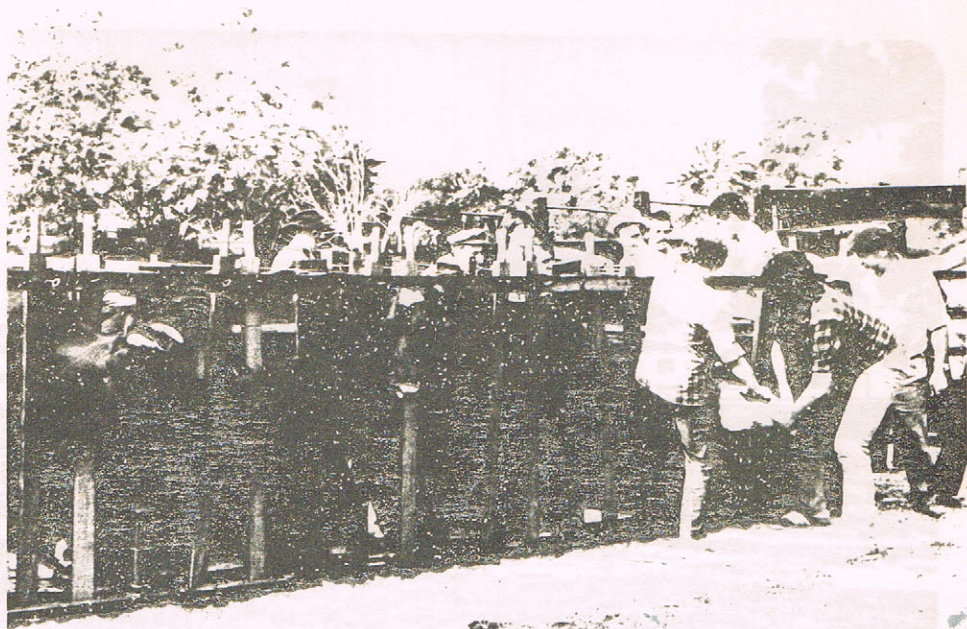
Vista general del Campo N° 1 de Miguel.