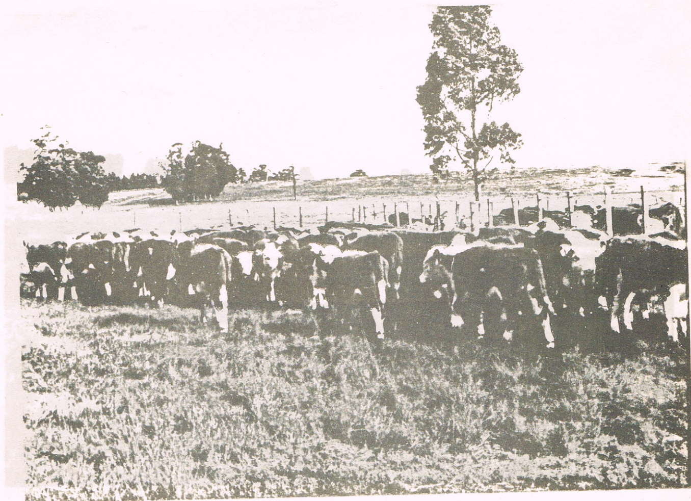
Vista general del Campo N° 1 de Mi- guel. Animales del Campo de Miguel.