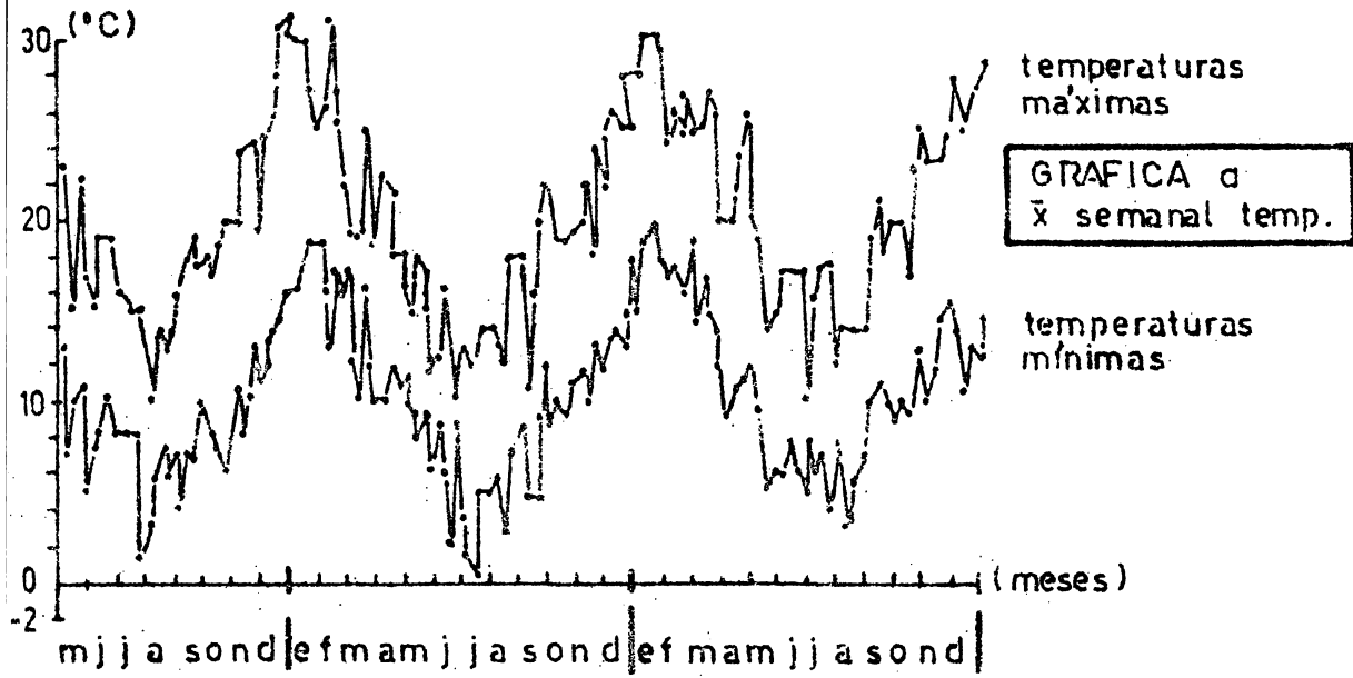
Fig. 3 : Registros meteorológicos acumulación años 1975 1976 promedios semanales.